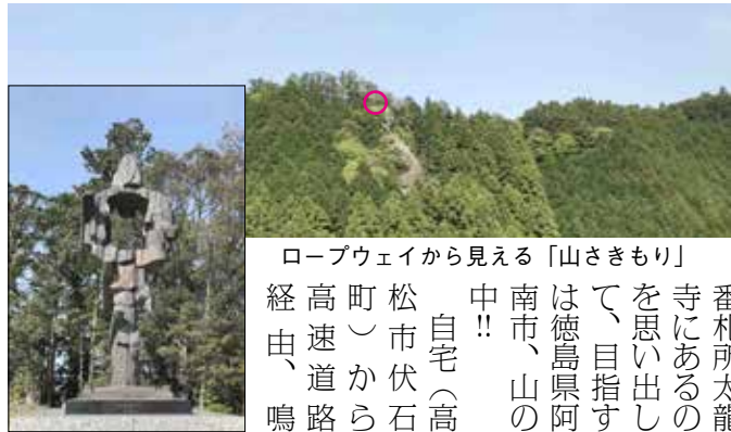
ロープウェイから見える「山さきもり」 番札所太龍寺にあるの 寺にあるの を思い出し て、目指す は徳島県阿 南市、山の 中!! 自宅(高 松市伏石 町)から 高速道路 経由、鳴

業後内務省入省。1945 (昭 和20)年12月に東京帝国大学総 長に就任。64 (昭和39)年に勲 一等瑞宝章、74 (昭和49)年に は勲一等旭日大綬章を受章。