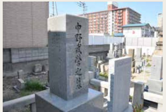
高松市浜ノ町の蓮華寺にある武営の墓碑と顕彰碑

88年4月に愛媛県会議長となった武営は、それまで培った中央の人脈を生かし、外務大臣として入閣していた大隈や内務省時代の上司だった松方正義(大蔵大臣)ら政府要人に、香川の分県独立を旧高松藩士らと共に働きかけたのではないかと。親密だった大隈の入閣に加え、大日本帝国憲法発布を翌年に控え、財政支出を伴う府県の配置を終えておきたいという内務省の思惑もあって、分県独立に成功したのです。それまで何度も独立