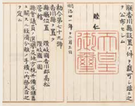
香川県設置の勅令

県(第1次)、73年に名東(みょうどう)県として徳島に編入されたものの、75年に再び香川県(第2次)に。しかしそれも長く続かず、11カ月後に愛媛県に編入。12年後の88(明治21)年12月3日に全国で最後の県として誕生したが、現在の香川県(第3次)です。