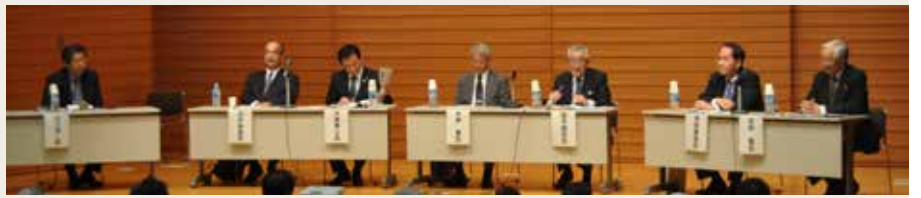
昨年10月8日に県立ミュージアムで開かれたシンポジウム